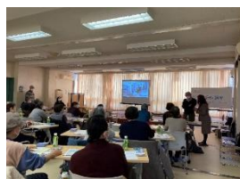
「グループあんあん」 の活動風景