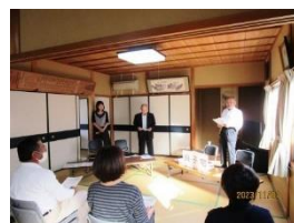
「ぎ・ひめみこ」 の活動風景