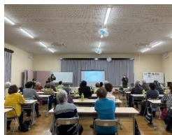
「グループあんあん」 の活動風景