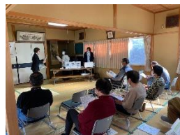
「ぎ・ひめみこ」 の活動風景