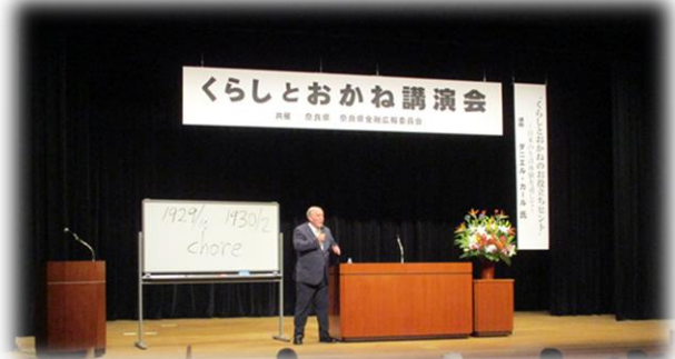
ダニエル・カール氏 講演会の様子