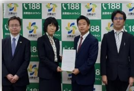
2024年2月20日消費者庁にて認定書交付式の様子

消費者の利益を損ねるような不当な勧誘・契約を行っている事業者に対して、消費者に代わって差止請求の訴訟を行う権限を付与された団体です。