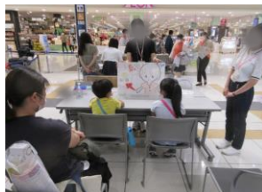
かみしばいクイズ