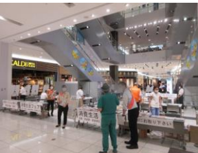
防犯電話の展示・体験