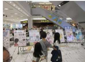
消費者教育・啓発ポスターの展示