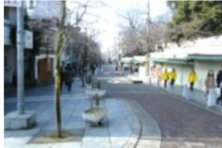
三条通（猿沢池付近）