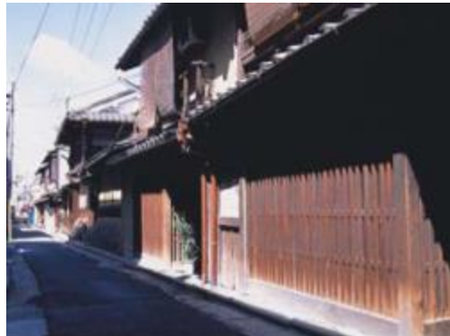
町屋の面影が残る町並み