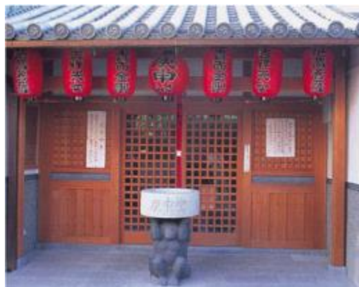
ならまちの庚申堂