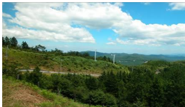
スカイラインから展望台への道と村有林