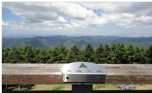
展望台からの眺望（大阪方面）