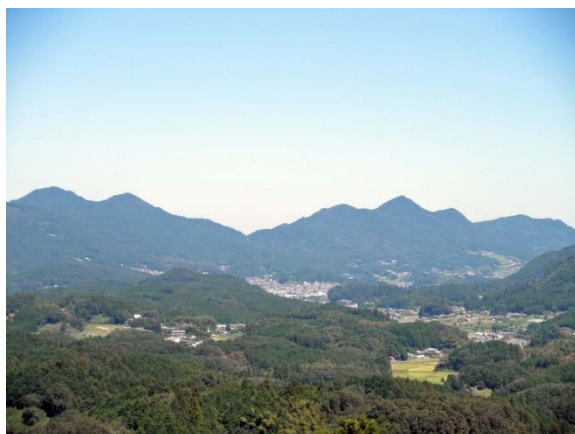
松山城跡頂上からの景観