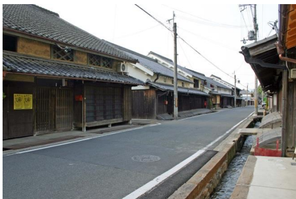
松山地区