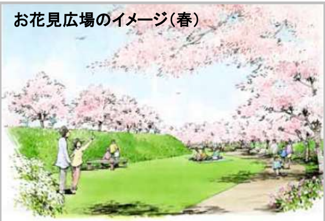
お花見広場のイメージ(春)