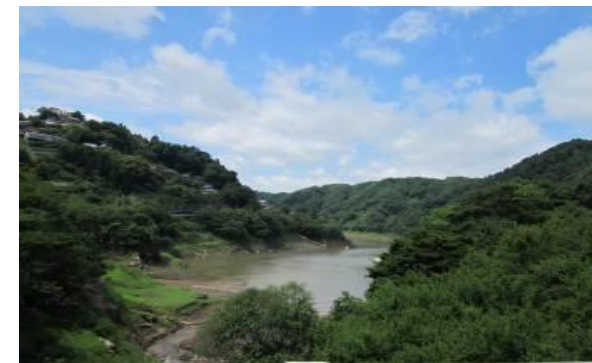
道路からのダム湖の景観