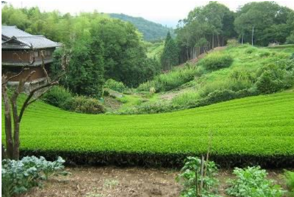
散策道からの農村風景