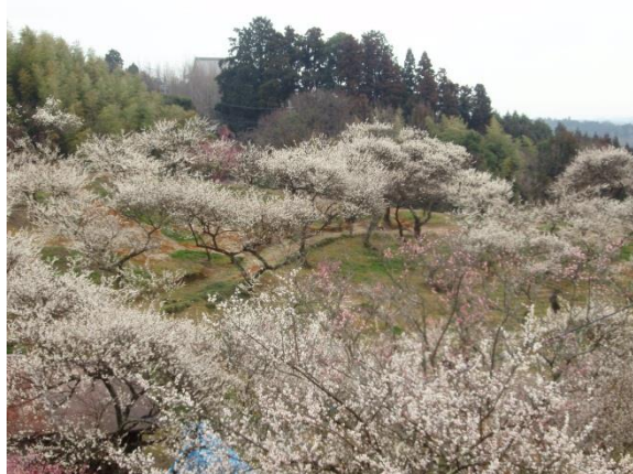
梅林と遠景に映る木々