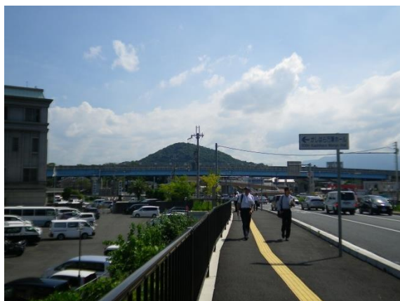
畝傍山をのぞむ景観

【今後の連携方策】 国、市、地域住民等との連携による、医療拠点にふさわしい植栽景観の維持管理の仕組みづくり。