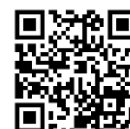
お問い合わせフォーム

身体障害者手帳等を有する人等で、点字や拡大文字による受験、手話通訳、車椅子の使用等を希望する場合は、申込時に特記事項欄に内容を入力してください。併せて、必ず申込期間中に人事委員会事務局まで電話又はお問い合わせフォーム（右記QRコード）より連絡してください。