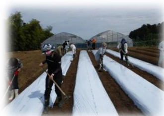
実習(畝立て・マルチ張り)