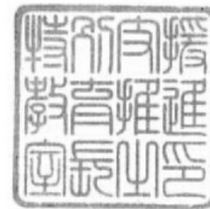
特別支援教育推進室長印