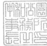
中和公園事務所長印