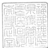
福祉医療部企画管理室長印