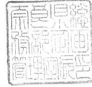
総務部企画管理室長印