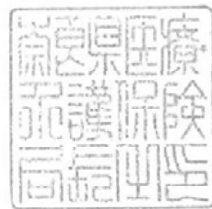
医療・介護保険局長印