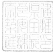
建築安全推進課長印