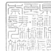
長寿・福祉人材確保対策課 長印