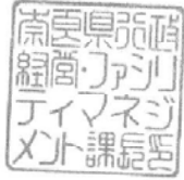
行政経営・ファシリティマ ネジメント課長印