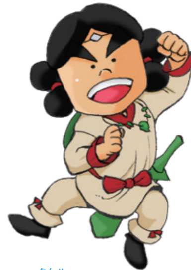
タケル 笑美のご先祖様で守り神。 笑美にしか見えない。