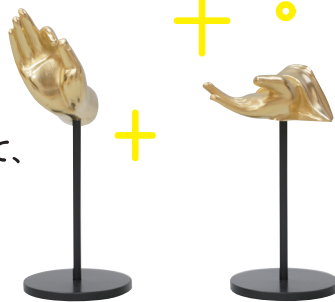
正暦寺薬師如来像 復元模型(手) 奈良県蔵