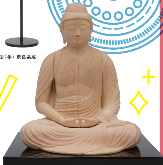
寄木造工程模型(粗彫り) 奈良県蔵