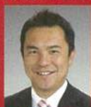
鈴木 英敬 三重県知事