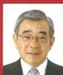
溝口 善兵衛 鳥根県知事