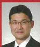
河野 俊嗣 宮崎県知事