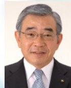
島根県知事 溝口 善兵衛