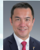
三重県知事 鈴木 英敬