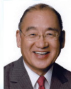
奈良県知事 荒井 正吾