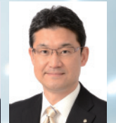
宮崎県知事 河野 俊嗣

2016年2月6日(土) 13時30分－16時30分(予定) [13時開場] 銀座ブロッサム(銀座中央会館)ホール