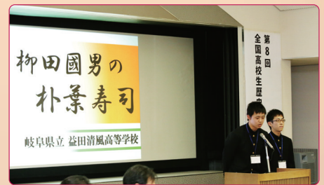
第8回全国高校生歴史フォーラムの様子