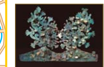
国(文化庁)保管