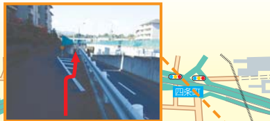
すいぜんてんのうりょう 綏靖天皇陵

石室内からは、武器、馬具、土器、副葬品など多数出土。なかでも馬具類は鞍金具に透かし彫という装飾豊かなものです。