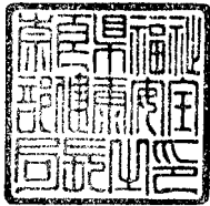
福祉部健康安全局長印