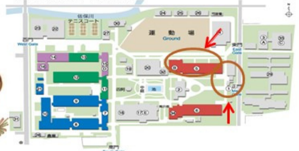
奈良女子大学キャンパス図